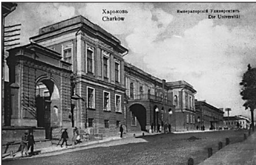
Навчальний корпус Харківського Імператорського університету (XIX ст.)

Історія становлення та розвитку фізичного виховання та спорту в Національному юридичному університеті імені Ярослава Мудрого починає свій відлік з 1804 р., коли на Слобожанщині був заснований юридичний факультет у складі Харківського Імператорського університету. За два роки до зазначеної події, ще 30 серпня 1802 р., на харківських губернських зборах дворянства засновник першого вищого освітнього закладу Слобожанщини В. Н. Каразін, оголошуючи «Предначертання в Харківському університеті», припускав у майбутньому поступово відкрити дев'ять відділень, у числі яких було б і «відділення приємних мистецтв», яке включало б навчання малюванню, музиці, танцям, фехтуванню та верховій їзді.